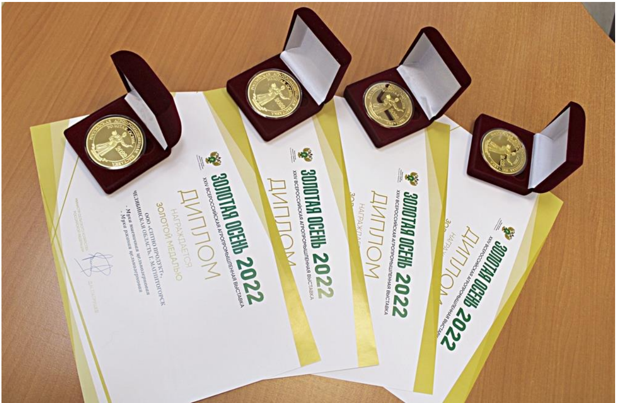
Рисунок 9 – Награды Российской агропромышленной выставки «Золотая осень 2022»

При содействии Министерства организуются поставки гуманитарной помощи. Предприятиями пищевой и перерабатывающей промышленности региона ООО «Ресурс», ООО «НВК «Ниагара», ООО «Уральский маслозавод», ООО «УК Сигма Холдинг», ООО «Объединение «Союзпищепром», ООО «СИТНО», АО «Макфа», Центр пищевой индустрии «Ариант», «Аква Ирендык», «Чебаркульский Исток» на безвозмездной основе сформированы продовольственные наборы, включающие муку, масло растительное, сухие смеси, питьевую воду, рис, макаронные изделия, крупы и мясные консервы на общую сумму 7,943 млн руб.. В подшефные города Ясиноватая и Волноваха ДНР 7 раз осуществлялась отправка гуманитарных грузов.