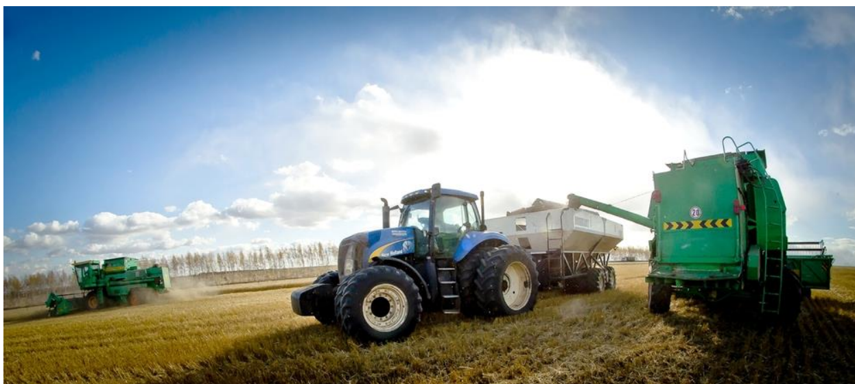
Рисунок 2 – Уборка зерновых в АО «Птицефабрика Челябинская»

Производство зерна составило 2,198 млн тонн в весе после доработки (в 2 раза больше, чем в 2021 г. (+1 млн 112,8 тыс. т). Это рекорд за последние 5 лет и второй показатель за последние 10 лет. Область приняла участие в государственных закупочных интервенциях. В качестве хранителя зерна государственного резерва объявлен элеватор ЗАО «Субутак» (Агаповский район). Аграриями региона продано на хранение в федеральный интервенционный фонд 20 000 тонн зерна (Рисунок 2). В сельхозпредприятиях и фермерских хозяйствах собрано картофеля 120,2 тыс. т (+18,3 тыс. т к 2021 г.), овощей 73,4 тыс. т (+14,1 тыс. т). В том числе в тепличных комплексах собран исторически рекордный урожай овощей: 39,7 тыс. т (+ 5,9 тыс. т). Масличных культур (лен, подсолнечник, рапс) собрано 247,2 тыс. т (+69 тыс. т.) – также рекордный урожай в истории Челябинской области.