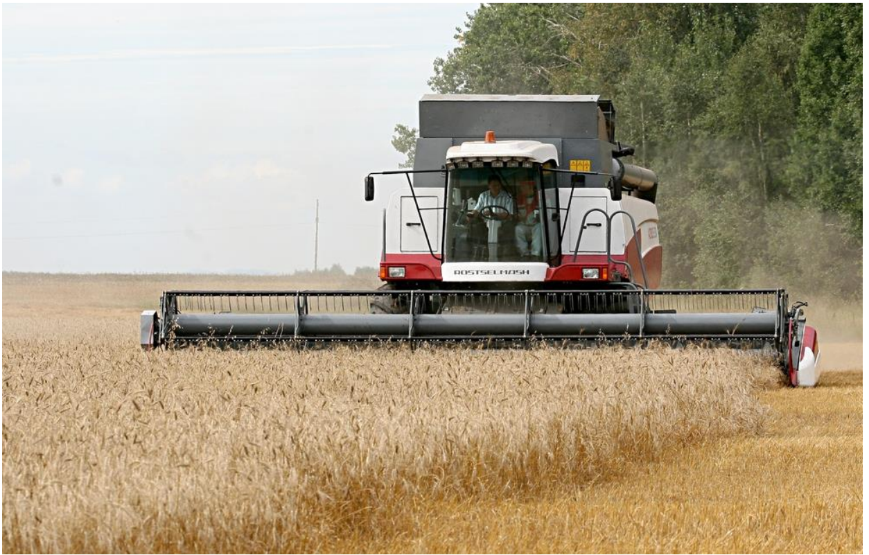
Рисунок 6 – Новый комбайн на полях ООО «Хлебинка», Верхнеуральский район

Одним из видов государственной поддержки является компенсация затрат на страхование. В 2022 году шести сельхозорганизациям выплачены субсидии на общую сумму 52,5 млн руб., в том числе 41,5 млн руб. из федерального бюджета. Доля застрахованного поголовья в общем поголовье сельскохозяйственных животных составила 58,9% (плановый показатель – 45%).