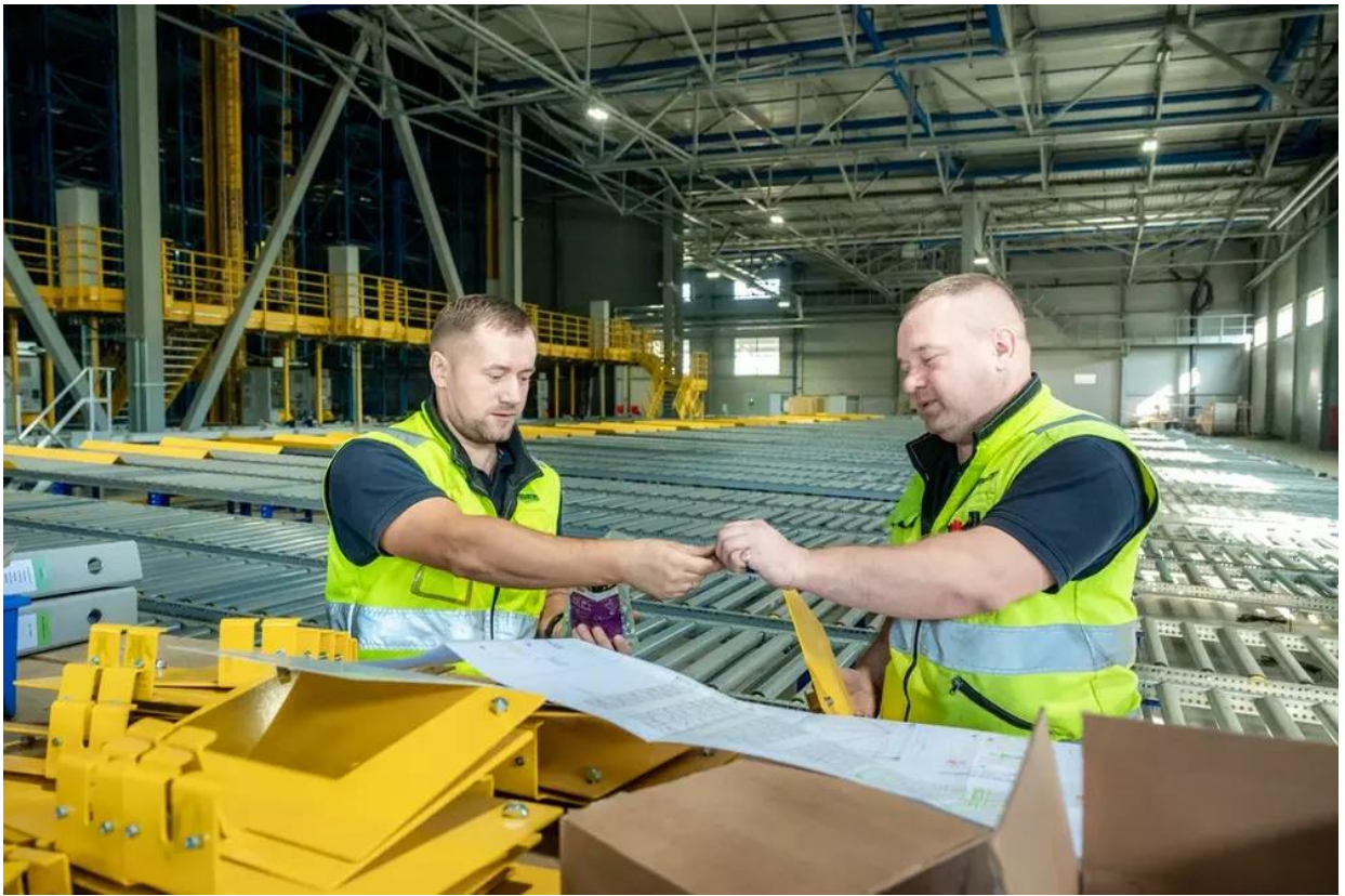
Рисунок 3 – Пусконаладка логистического комплекса «Макфа»

Челябинская область занимает первое место в Уральском федеральном округе по экспорту аграрной продукции и продовольствия. По предварительным данным, за 2022 год объем агроэкспорта из Челябинской области составил 150,4 млн долларов США. Основные поставки идут в страны ШОС – Казахстан, Киргизию, Китай, Таджикистан, Узбекистан. Особое внимание уделяется малым формам хозяйствования на селе. В растениеводстве доля фермерских хозяйств составляет 46%. Они обрабатывают 47% областной пашни, собирают половину областного урожая зерна, овощей и картофеля (Рисунок 4).