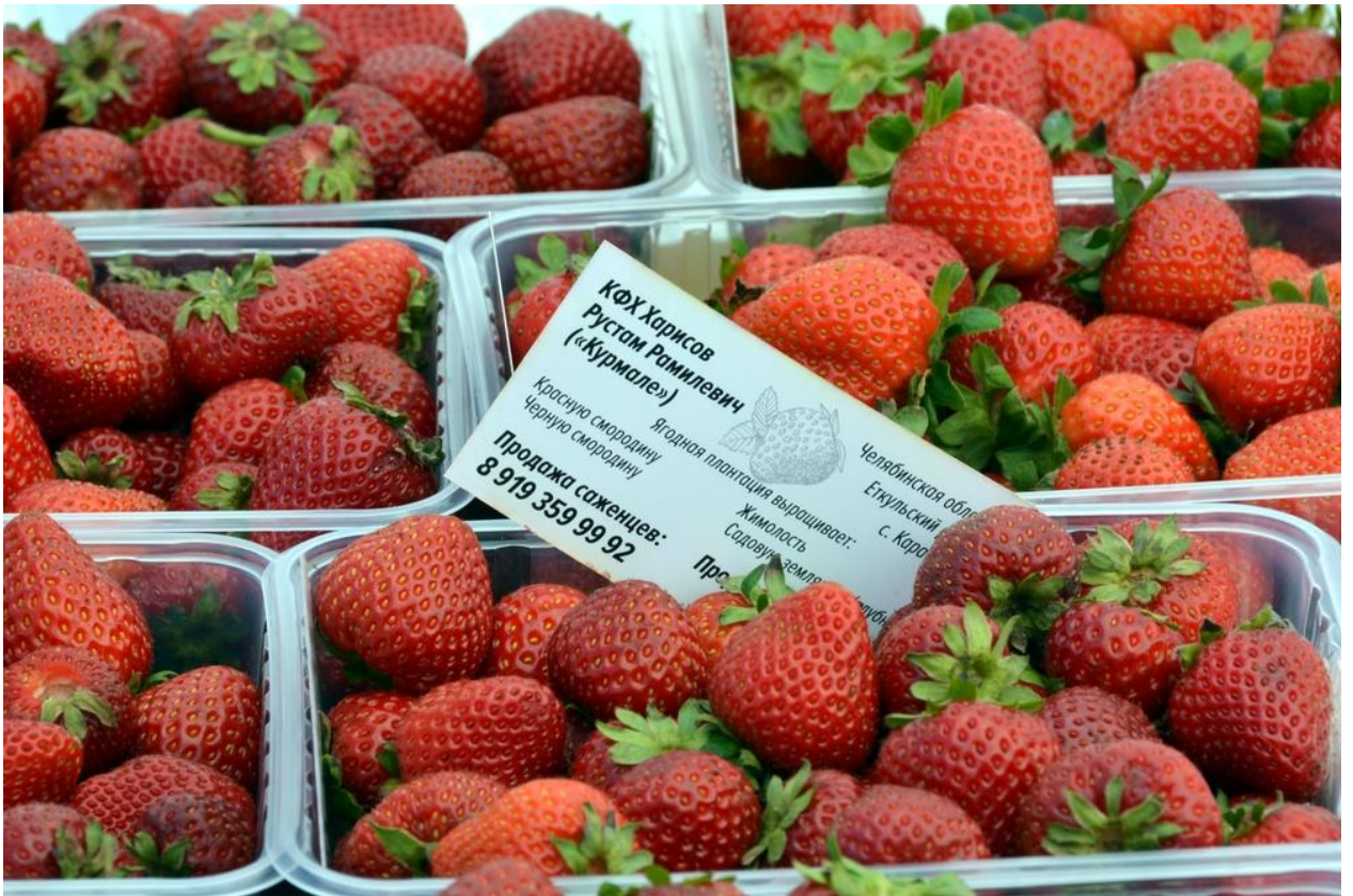
Рисунок 5 – Гранты «Агростартап» помогают развивать ягодные хозяйства

Темпы развития аграрного производства напрямую зависят от модернизации технического парка. В 2022 году аграрии приобрели 956 единиц техники на общую сумму 3 млрд 735 млн руб. (Рисунок 6). В том числе приобретено 236 единиц элементов оборудования из систем обеспечения точного земледелия на сумму 35 млн руб. В условиях санкций решается вопрос по замене импортных запчастей к сельхозтехнике на отечественные, в связи с чем выстраивается сотрудничество ПАО «ММК» с АО «Ростсельмаш». В ноябре 2022 года подписано соглашение о сотрудничестве региона с ОАО «Минский тракторный завод» по поставкам сельскохозяйственных тракторов марки «Беларус».