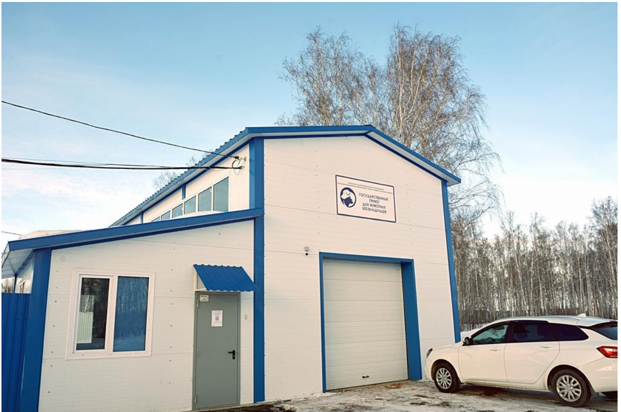
Рисунок 8 – Государственный приют для животных в Сосновском районе

Важным направлением работы Министерства является регистрация самоходной техники и её технический осмотр. Оказано 34 015 государственных услуг: зарегистрировано 9 089 единиц самоходной техники, проведено 13 940 технических осмотров самоходной техники, выдано 10 986 удостоверений тракториста-машиниста. Рассмотрено 368 заявлений на регистрацию аттракционов, зарегистрировано 88 аттракционов.