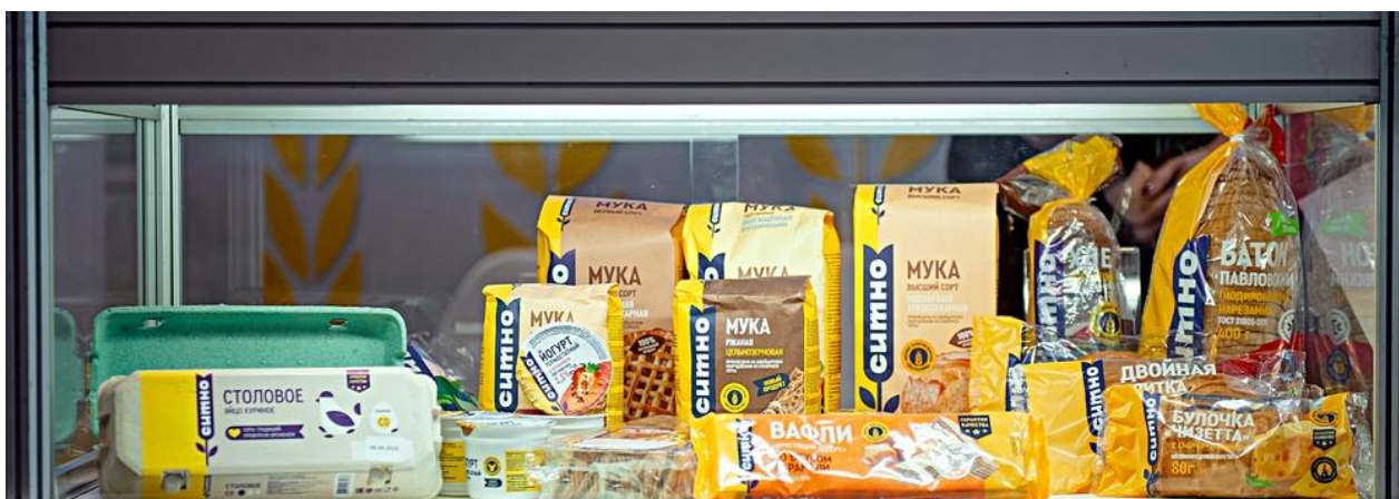
Рисунок 1 – Экспозиция компании «СИТНО»

Благодаря этой стратегии Челябинская область входит в первую десятку регионов России по производству мяса птицы, свинины, куриных яиц. В первую тройку – по производству макаронных изделий, муки, круп (Рисунок 1). Занимает первое место в Уральском федеральном округе по экспорту продукции АПК.