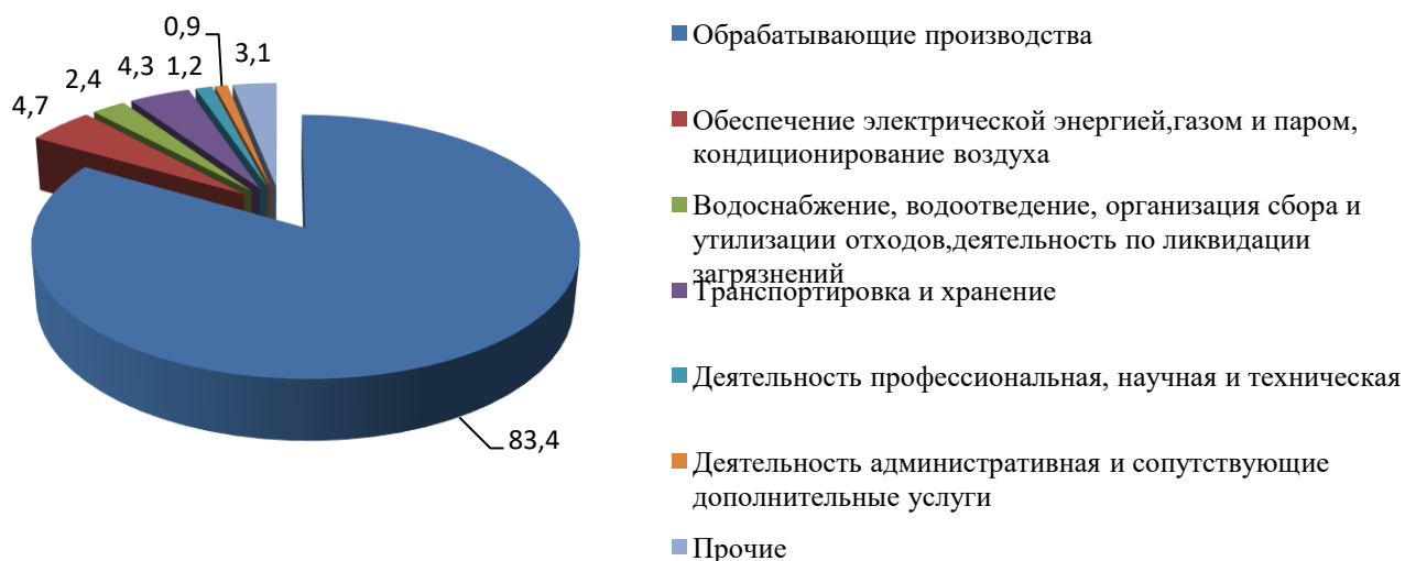
Структура объема отгруженных товаров, выполненных работ и услуг собственными силами, процентов

Исполнение бюджета округа за 2025 год составило 8931,5 млн. руб. (98,2% от утвержденных годовых бюджетных назначений), что меньше на 1007,5 млн. рублей (89,9%) показателя 2024 года.