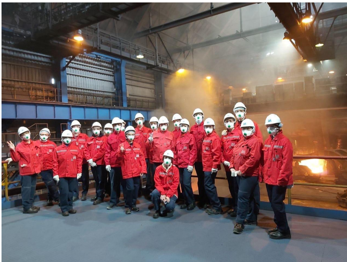
Рисунок 4 – Промышленный туризм на ММК

Челябинская область активно включилась в реализацию национального проекта «Туризм и индустрия гостеприимства», войдя в число пилотных субъектов РФ по реализации регионального проекта «Повышение доступности туристических продуктов (Челябинская область)». В рамках проекта 8879 школьников 5-9 классов смогли отправиться в двухдневный тур по родному краю (Рисунок 5).