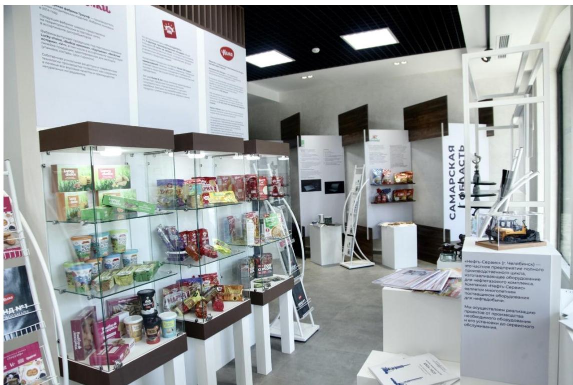
Рисунок 2 – Шоу-рум производителей Челябинской области в Узбекистане