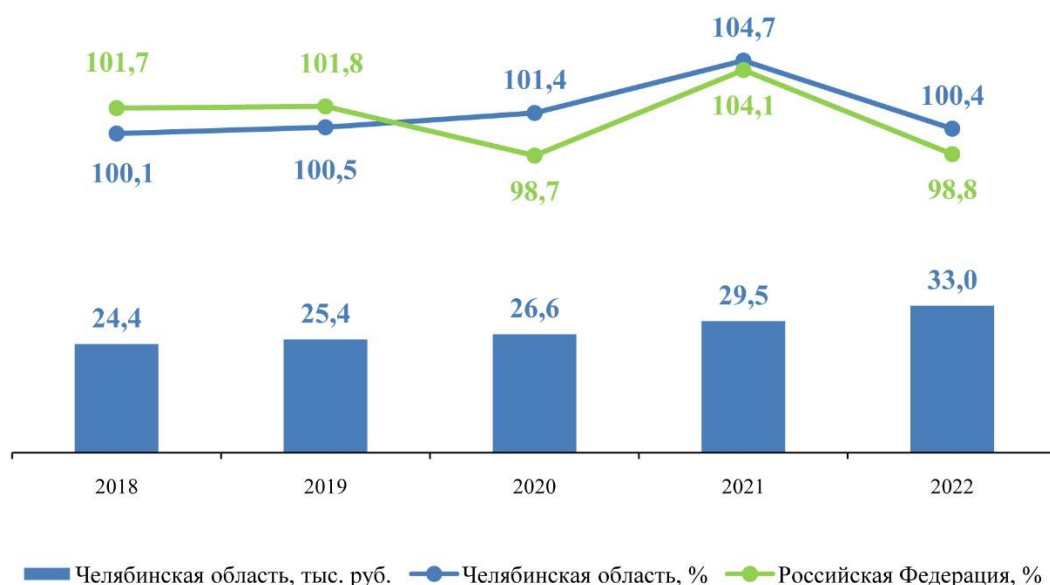
График 3 – Денежные доходы населения (реальные и среднемулические)

За 2022 год Челябинская область занимает 11 место среди регионов Российской Федерации по реальным среднемулическим денежным доходам – 100,4%. Среднемесячные доходы на душу населения в 2022 году увеличились на 11,9 % к 2021 году и составили 33 017 рублей (График 3).