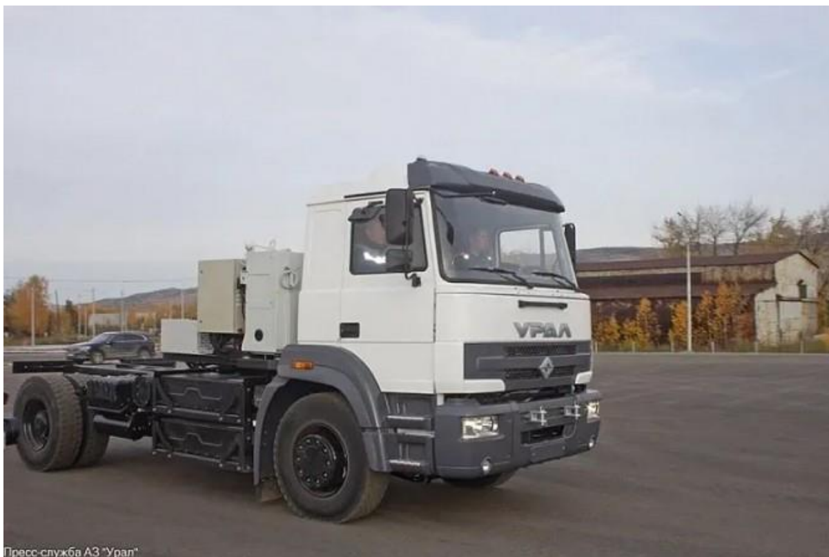
Рисунок 3 – Опытный образец грузовика автозавода «Урал»

Причем реализация подобных проектов возможна благодаря созданию специальных территорий опережающего развития (ТОР).