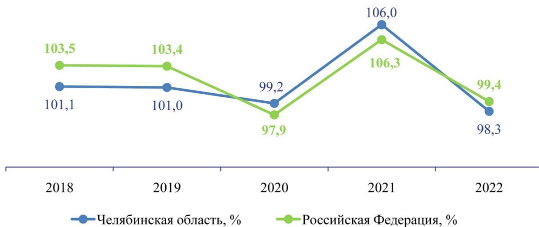
График 2 – Показатели индекса промышленного производства Челябинской области

Несмотря на сложность текущей ситуации в стране Челябинской области удалось сохранить стабильность в работе базовых отраслей за счет постепенного процесса импортозамещения, ориентира на внутрироссийский спрос, внедрения новых производств, реализации инвестиционных проектов, выстраивания новых логистических цепочек, а также переориентации на новые рынки сбыта и поиска новых партнеров за пределами страны.