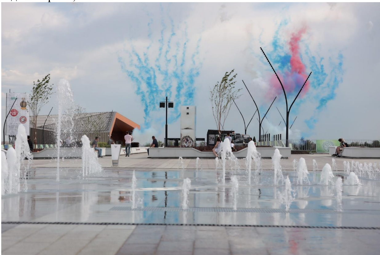
Рисунок 7 – Открытие первой очереди парка «Притяжение»

строительство аквакомплекса, детского центра развлечений, фристайл арены, ледовой арены, отеля.