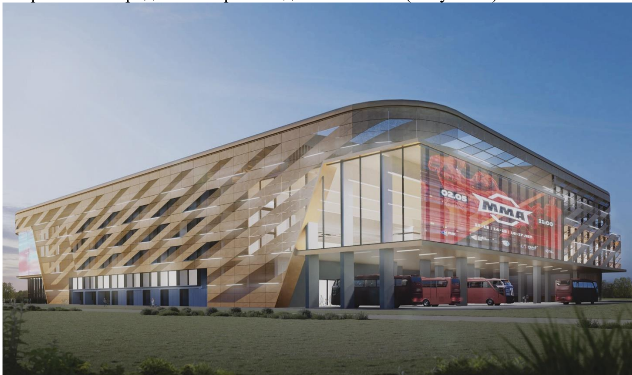
Рисунок 6 – Проект РМК-арены в спортивном городе

В Челябинской агломерации реализованы масштабные проекты по благоустройству набережной реки Миасс, проведена реконструкция Ленинградского моста, ведется проектирование и строительство крупного спортивного города на северо-западе Челябинска (Рисунок 6).