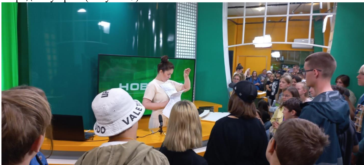
Рисунок 5 – Школьники 5-9 классов Озерского, Снежинского городских округов и Каслинского муниципального района в туре «Тихо – идёт съёмка!»

Челябинская область активно включилась в реализацию национального проекта «Туризм и индустрия гостеприимства», войдя в число пилотных субъектов РФ по реализации регионального проекта «Повышение доступности туристических продуктов (Челябинская область)». В рамках проекта 8879 школьников 5-9 классов смогли отправиться в двухдневный тур по родному краю (Рисунок 5).