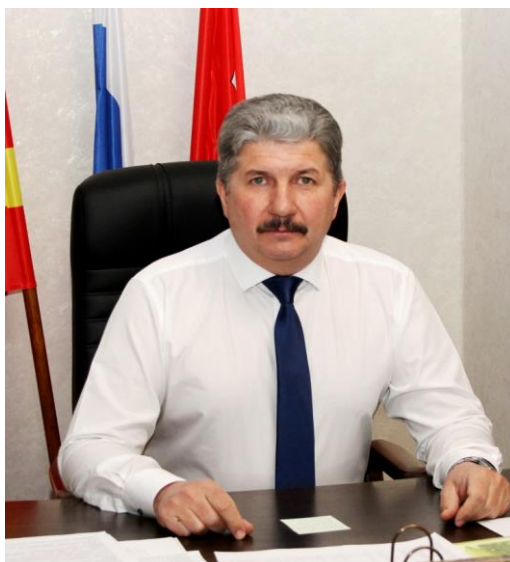
Глава Еткульского муниципального округа Челябинской области Кузьменков Юрий Владимирович

Администрация Еткульского муниципального округа Челябинской области, Российская Федерация, Челябинская область, 456560 с. Еткуль, ул. Ленина, 34 тел. 8(35160) 2-13-49 (приемная) e-mail: orgotd_etc@mail.ru e-mail: https://www.admetkul.ru/