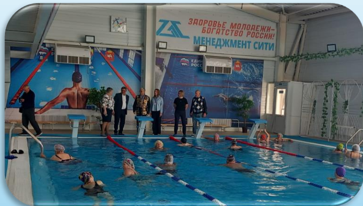
Физкультурно-оздоровительный комплекс «ФОКУС»