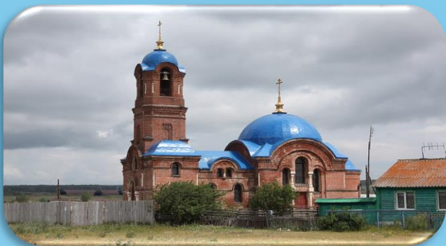
Церковь Архангела Михаила