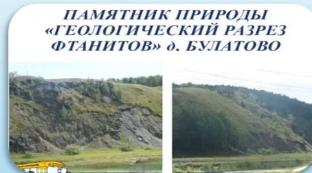
Геологический разрез фтанитов