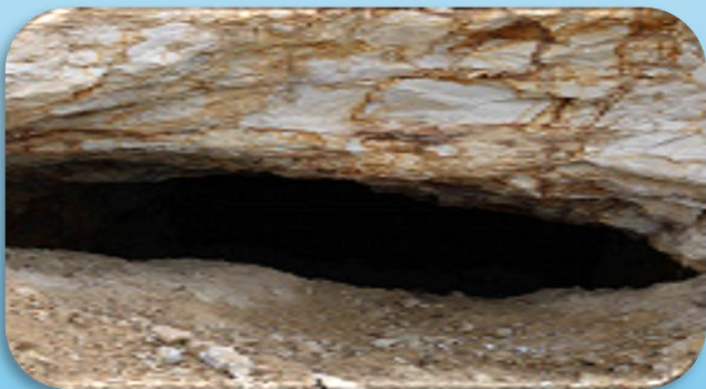
Пещера, где Емельян Пугачев хранил свое оружие