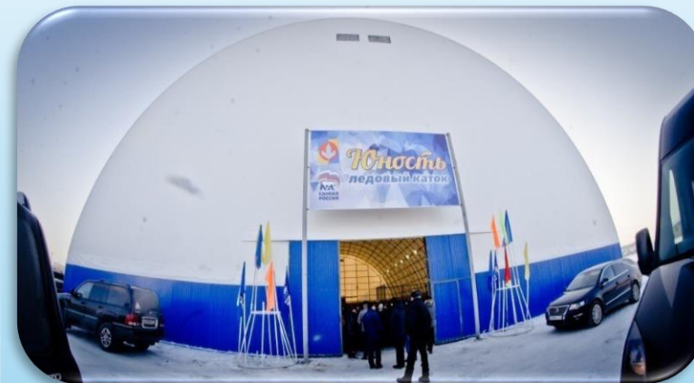
Ледовый каток «Юность»

78 спортивных сооружений 2 плавательный 1 стадион 1 лыжная база 15 спортивных залов 1 спортивная школа 252 человека посещают спортивную школу 13 спортивно-массовых мероприятий в 2025 году 41 призовое место на всероссийских, региональных и областных соревнованиях 79,3% доля граждан округа, занимающихся физкультурой и спортом