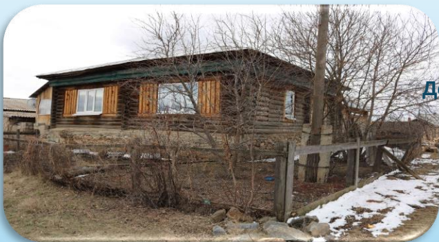
Дом, где побывал цесаревич Никоолай II