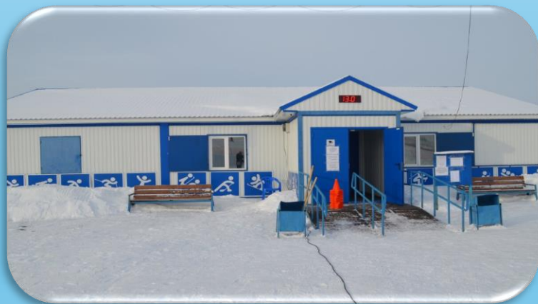
Лыжная база «Олимпиец»

78 спортивных сооружений 2 плавательный 1 стадион 1 лыжная база 15 спортивных залов 1 спортивная школа 252 человека посещают спортивную школу 13 спортивно-массовых мероприятий в 2025 году 41 призовое место на всероссийских, региональных и областных соревнованиях 79,3% доля граждан округа, занимающихся физкультурой и спортом