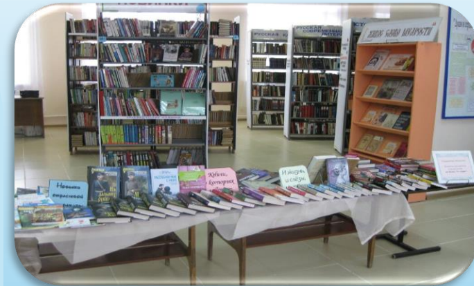
Центральная библиотека «Неделя сюрпризов для читателей»

240 603 человек посетило библиотеки в 2025 году